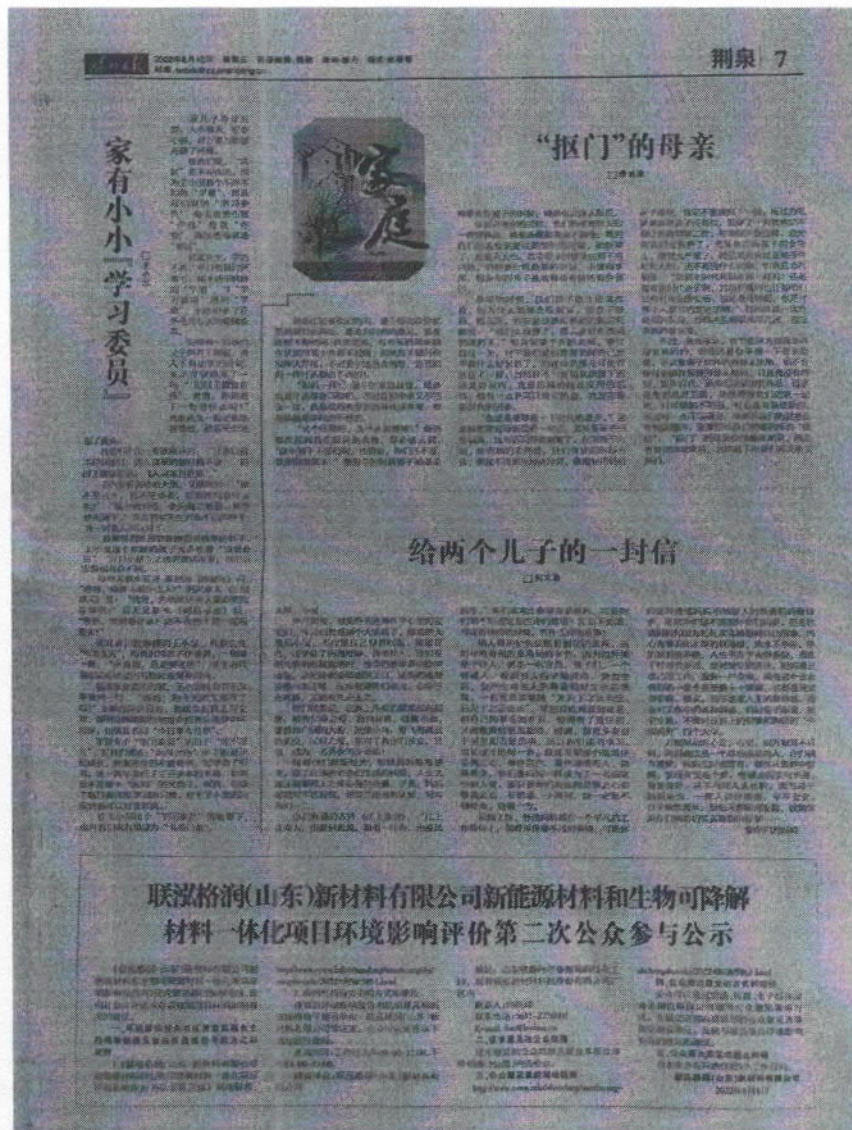
图 3.2-2a 报纸公示第一次（2022 年 8 月 10 日）

报纸公示时间：第一次公示时间 2022 年 8 月 10 日；第二次公示时间 2022 年 8 月 11 日，截图见图 3.2-2。