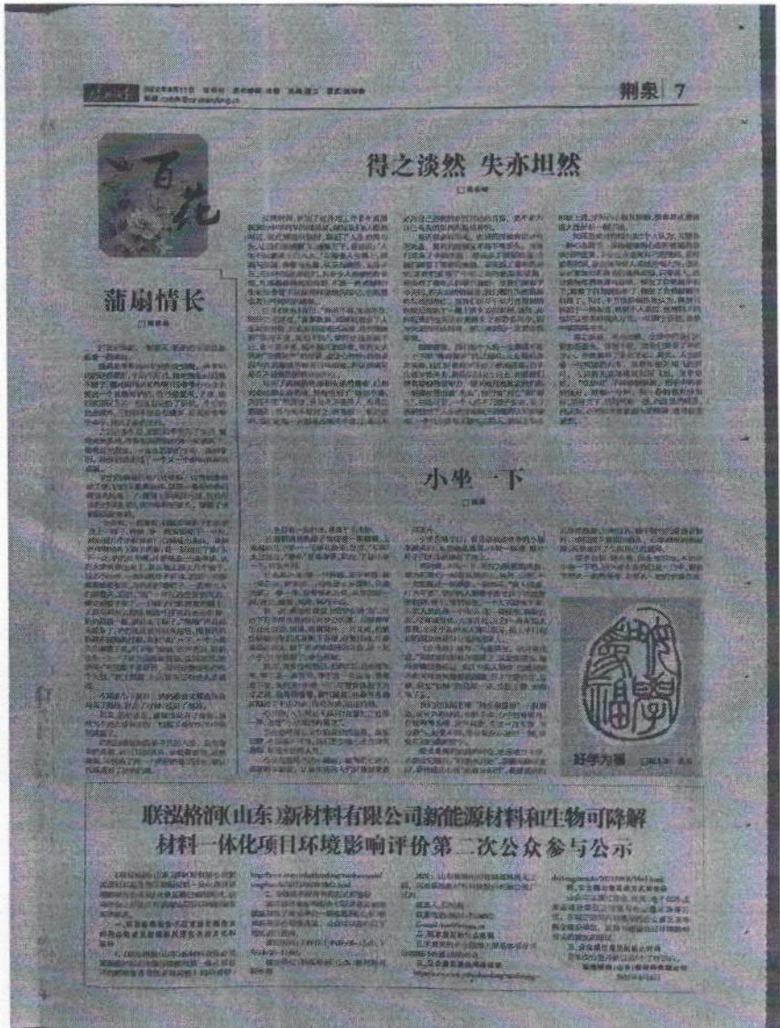
图 3.2-2b 报纸公示第二次 (2022 年 8 月 11 日)