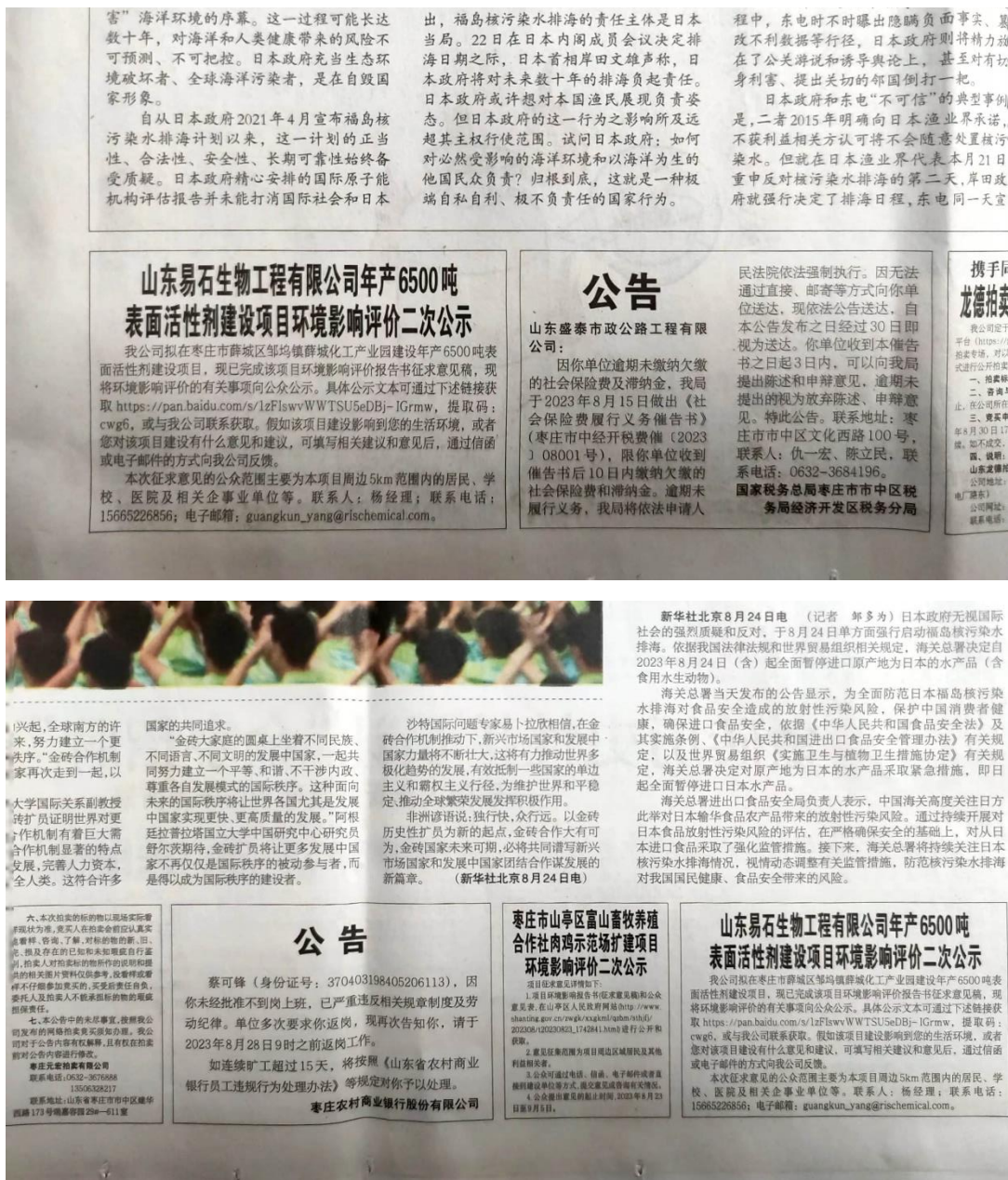
图 3-2 二次公示登报情况

《枣庄日报》是中共枣庄市委的机关报，在枣庄地区发行量较大。为提高本项目环境影响评价公众参与的广泛性、便利性、真实性，我公司选取《枣庄日报》进行环评信息公示，载体选取符合相关要求。报纸公示的相关截屏见图3-2。