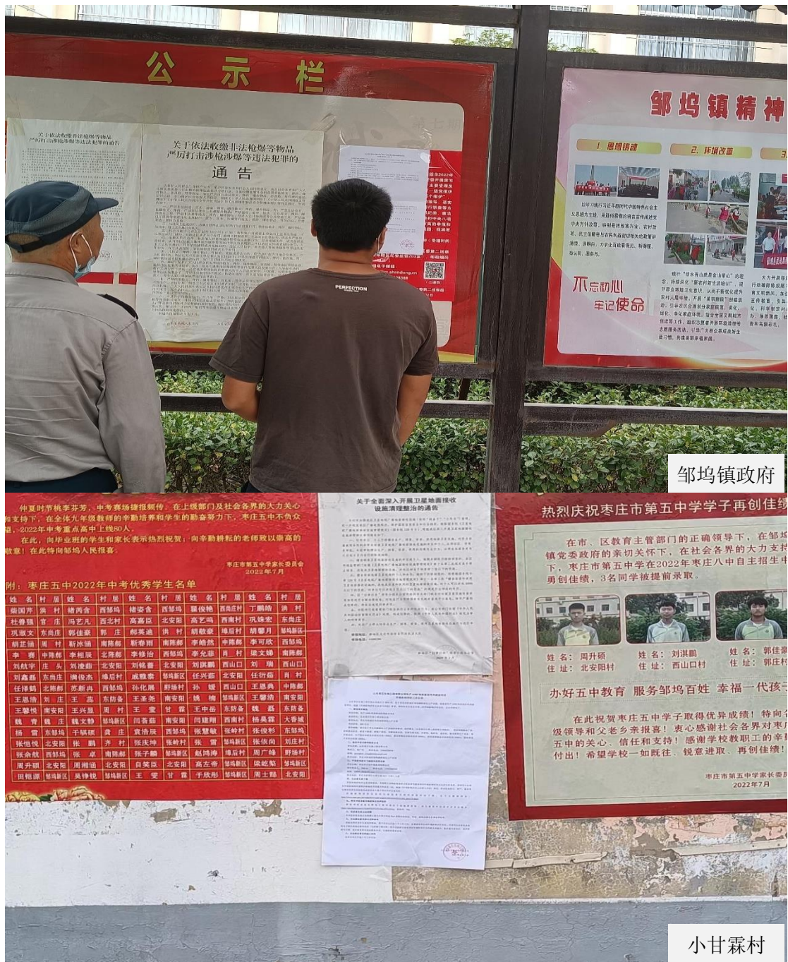
图 3-3 二次公示周边村庄张贴情况