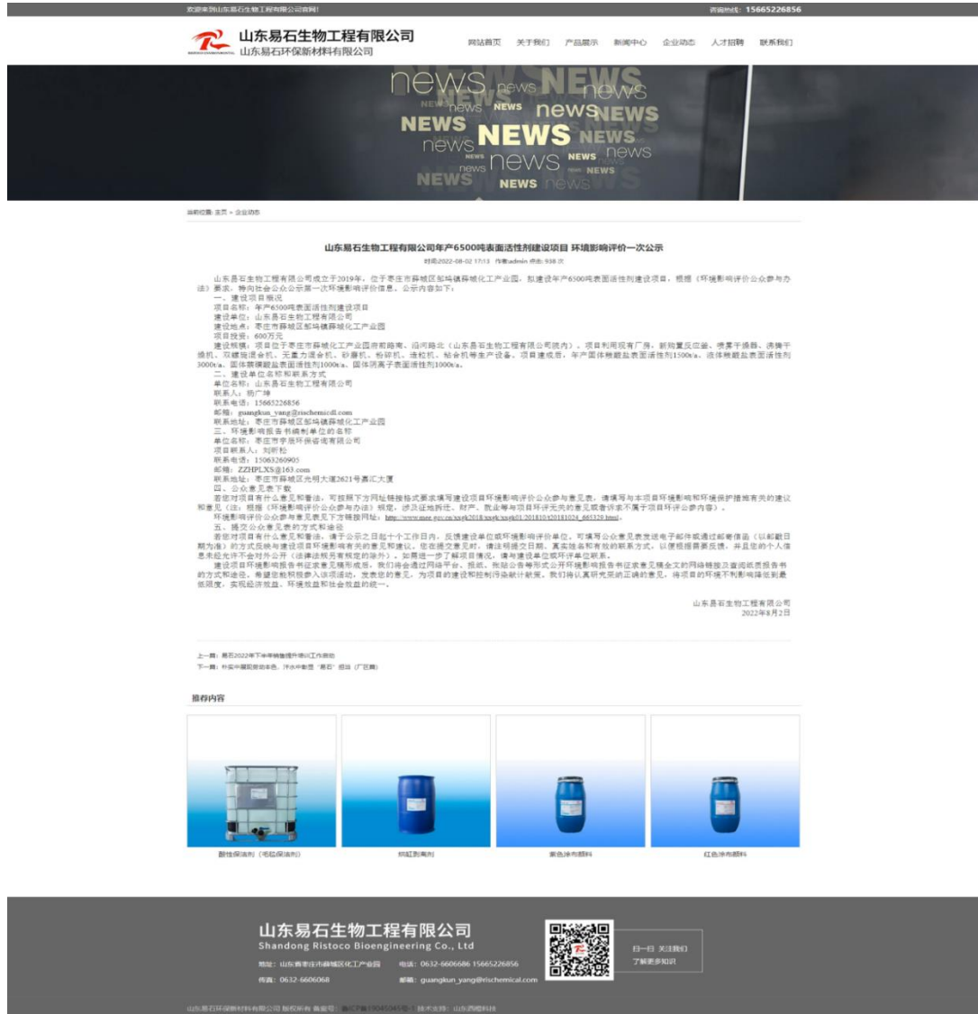
图 2-1 一次公示