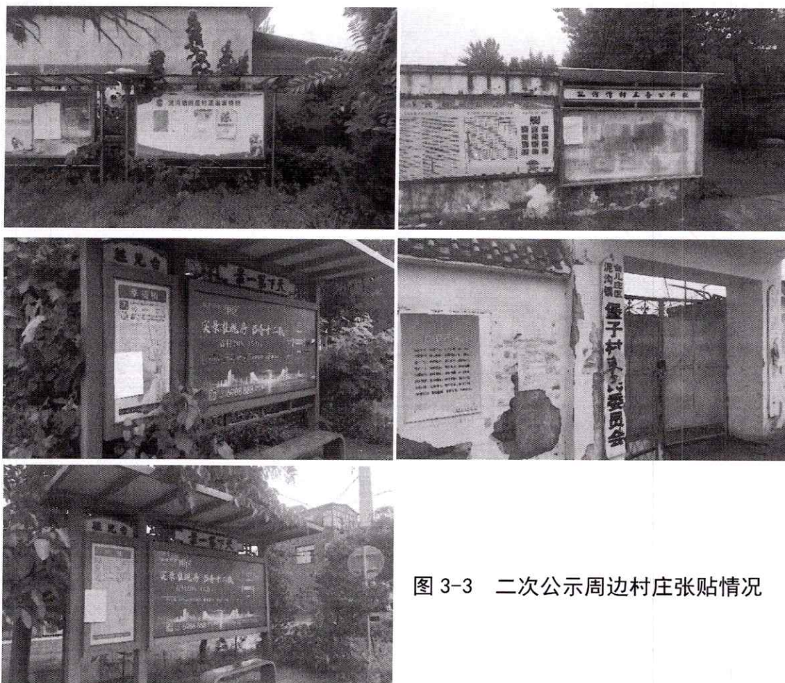
图 3-3 二次公示周边村庄张贴情况