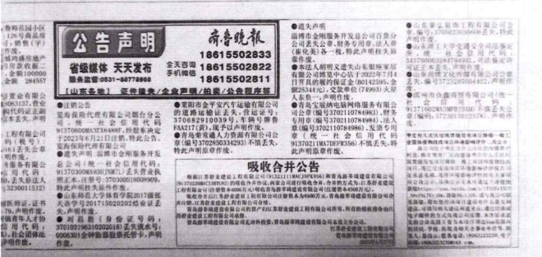
图 3-2 二次公示登报情况

运营商要进行精准治理。比如，对运营商基层工作人员的推销全过程，要求录音录像以备查，可倒逼推销行为规范化。又如，所谓“送手机”活动，究竟是免费赠送还是附加相关条件，都应该明确告知用户。另外，运营商与消费金融公司之间的合作行为，也要规范。 据北京青年报 据北京晚报