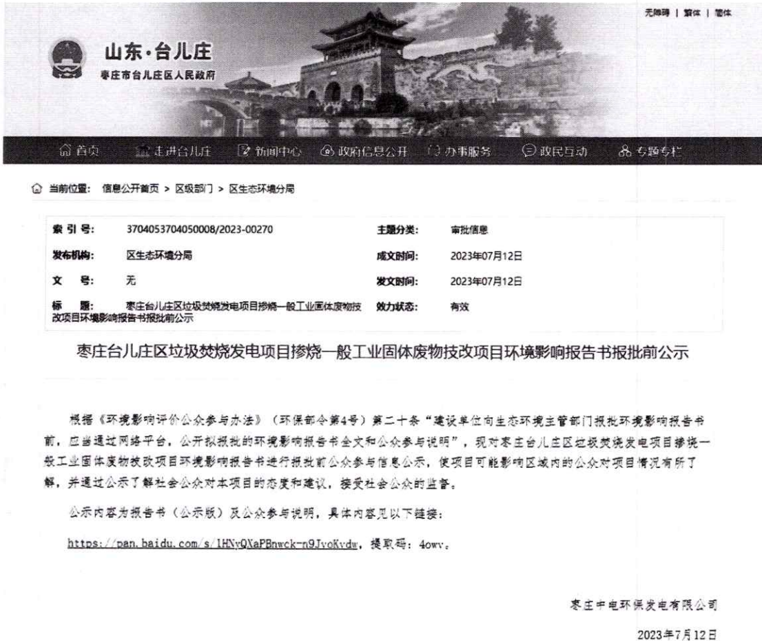
图 6-1 报批前公示

本项目第三次信息公示在台儿庄区人民政府网站，符合《环境影响评价公众参与办法》要求。公示时间为2023年7月12日。公示网址： http://xxgk.tez.gov.cn/qjbm/qsthjfj/202307/t20230712_1696056.html 。