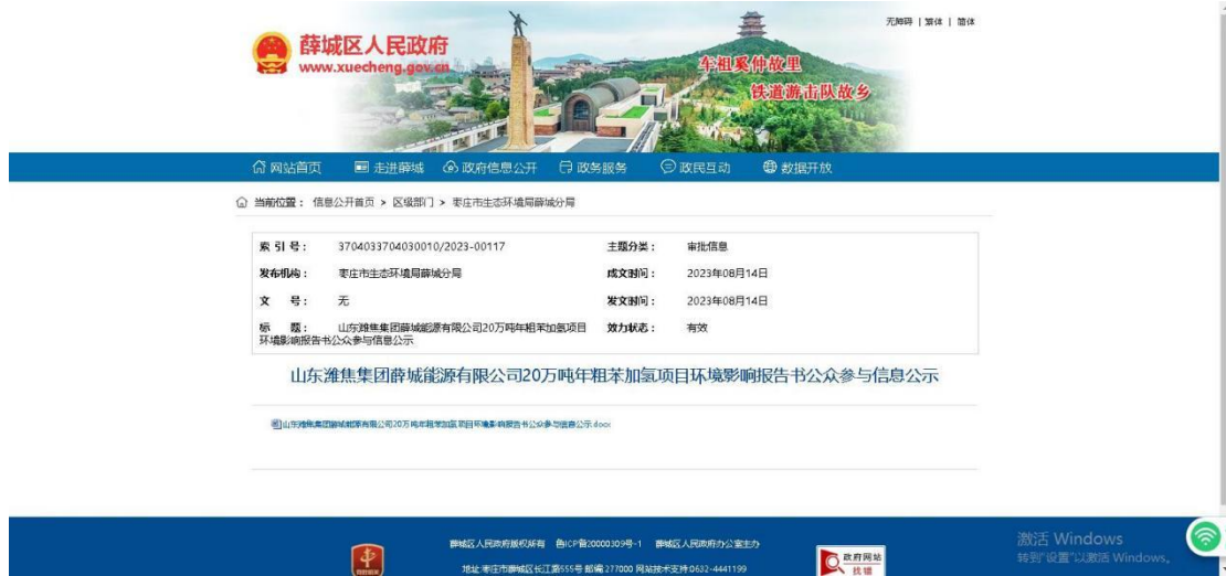
图 6.2-1 报批前网络公示截图

响评价公众参与办法》第二十条“建设单位向生态环境主管部门报批环境影响报告书前,应当通过网络平台,公开拟报批的环境影响报告书全文和公众参与说明。”的要求。公开的截屏图片见图 6.2-1。