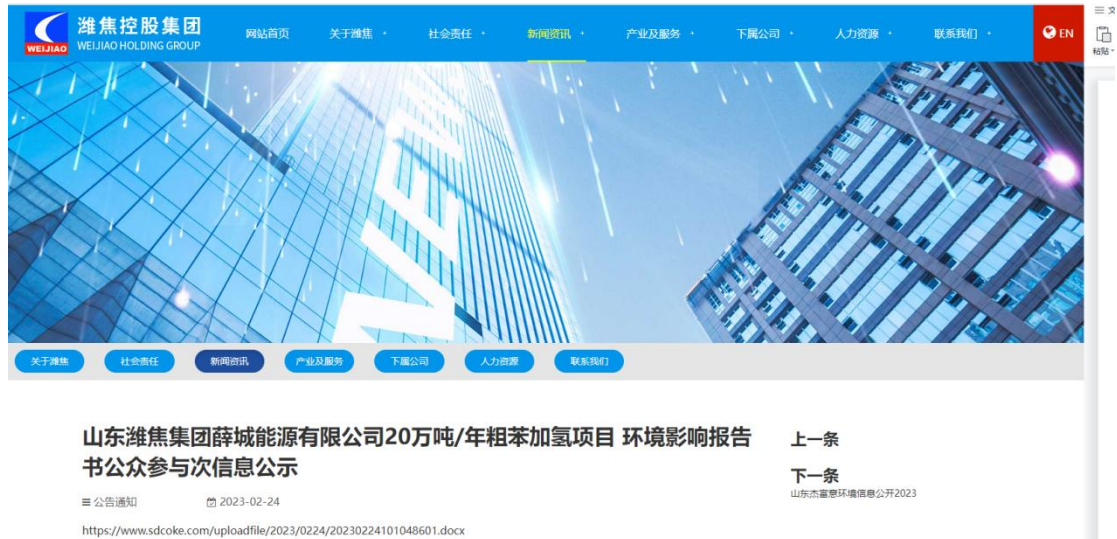
图 2.2-1 首次网上公示截图