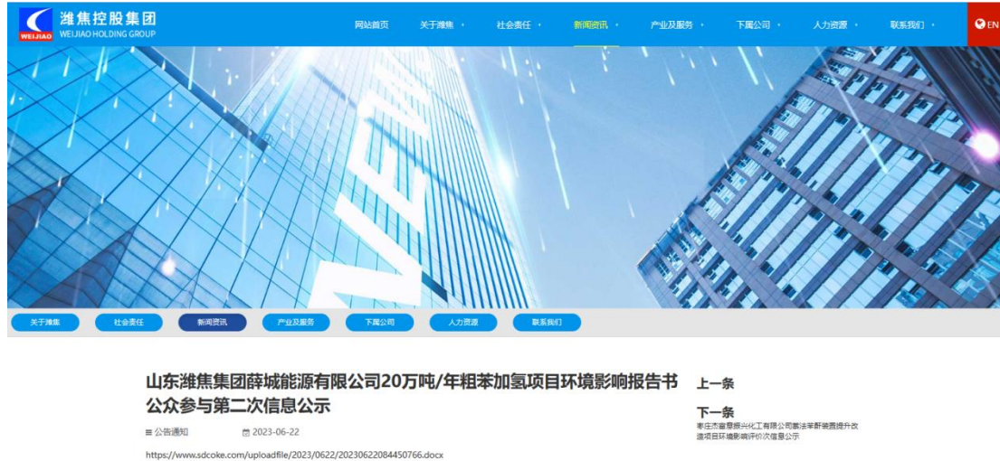
图 3.2-1 征求意见稿网上公示截图

山东潍焦控股集团网站是山东省内媒体网络平台，载体的选择符合《环境影响评价公众参与办法》要求。公示时间为2023年6月22日至2023年7月4日10个工作日，符合《环境影响评价公众参与办法》第十一条“通过网络平台公开，且持续公开期限不得少于10个工作日”的要求。公示的截屏图片以及全文见图3.2-1。