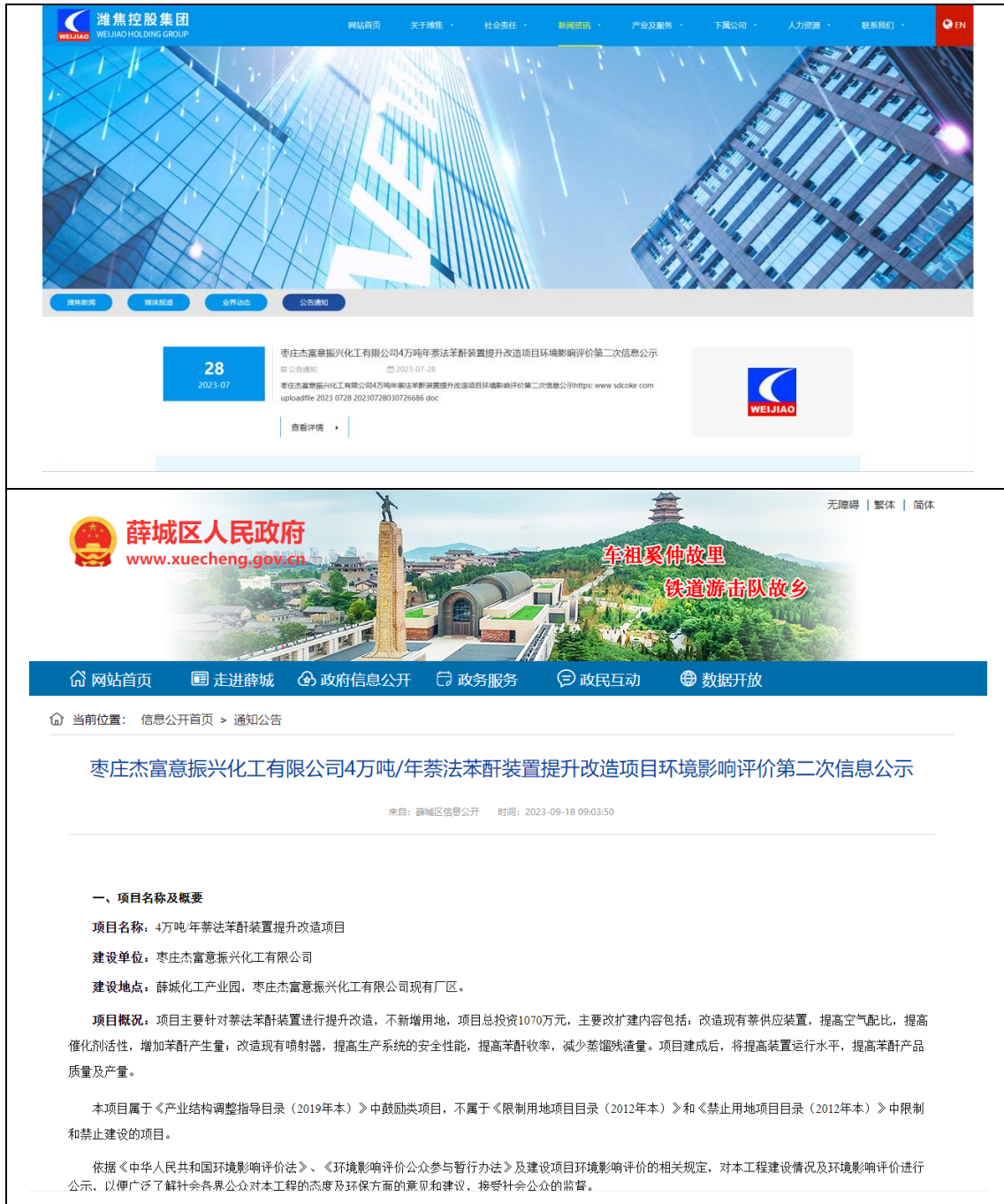
图 3.2-1 第二次公示网站截图