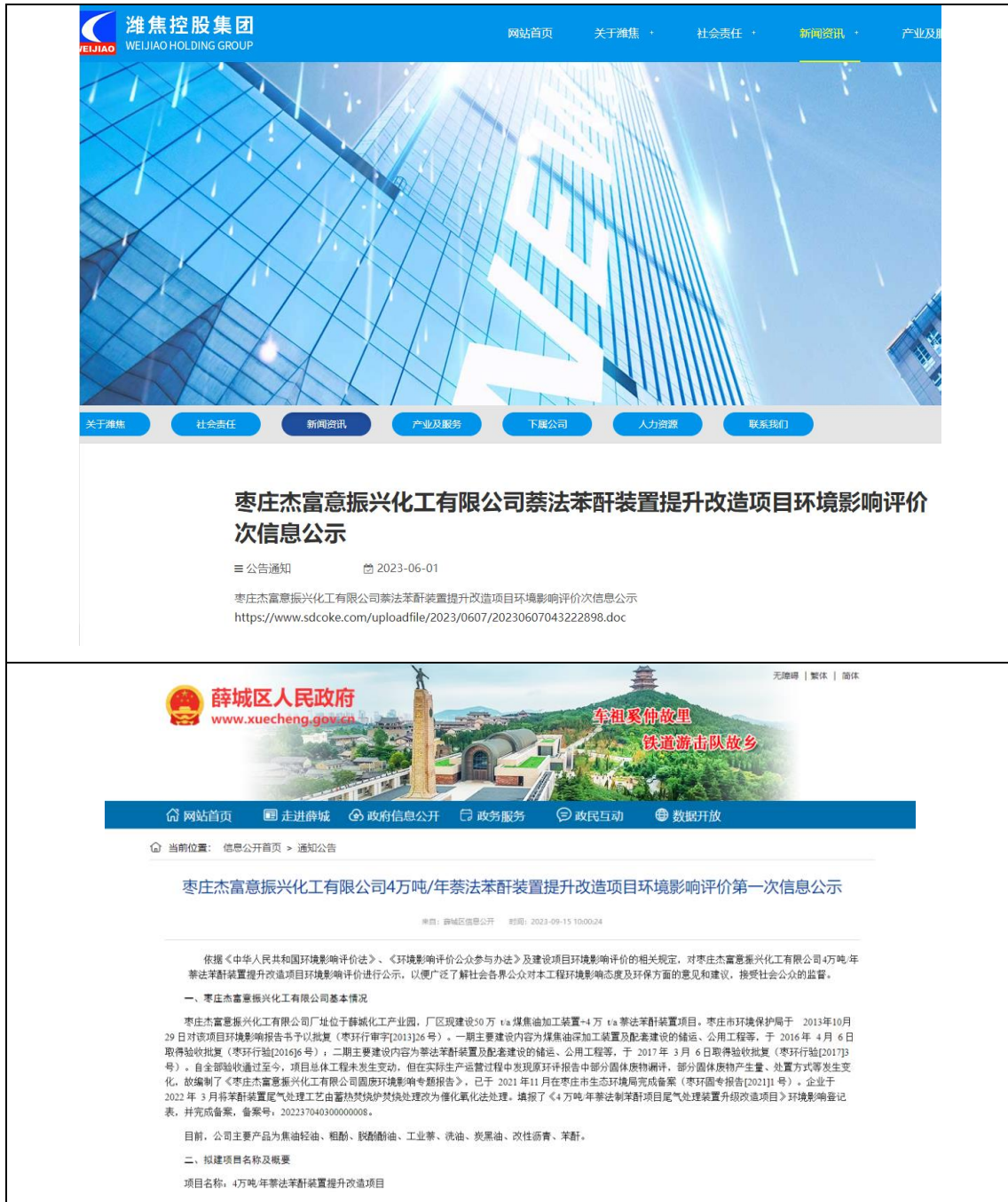
图 2.2-1 第一次公示网站截图