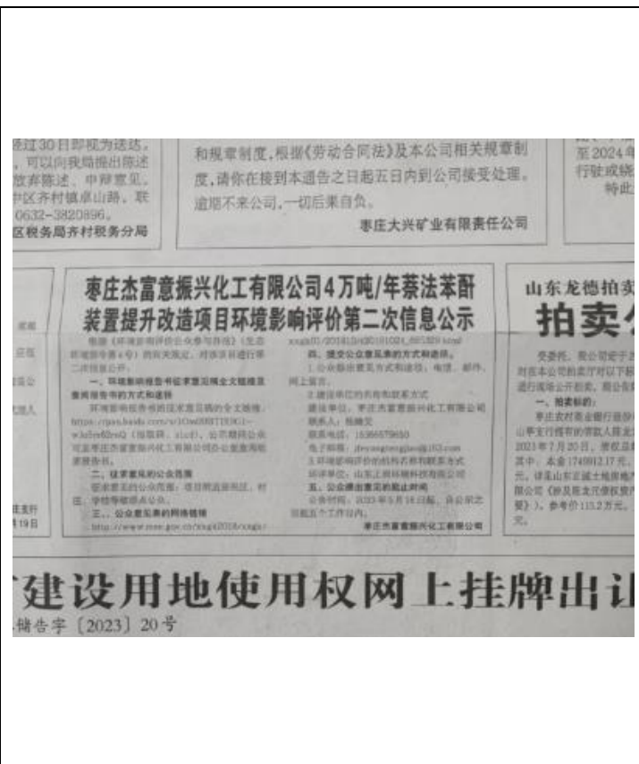
2023年9月19日第一次公示报刊截图