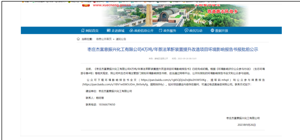
图 6.2-1 报批前公示网站截图