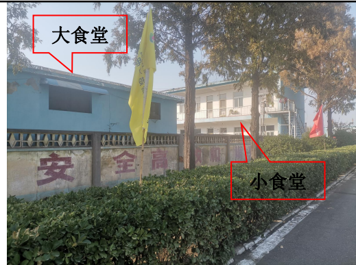
站址拟建区域西侧