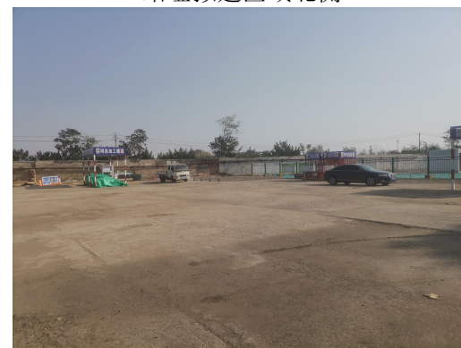
站址拟建区域南侧