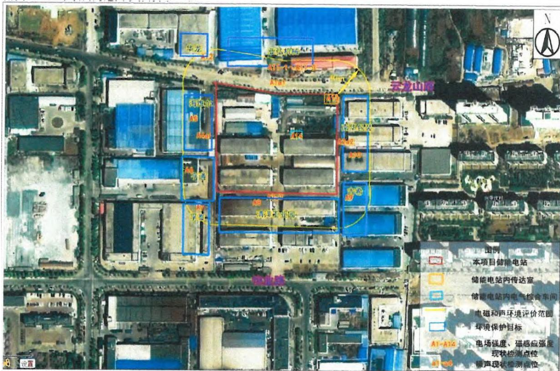
图 3-2 类比监测布点示意图