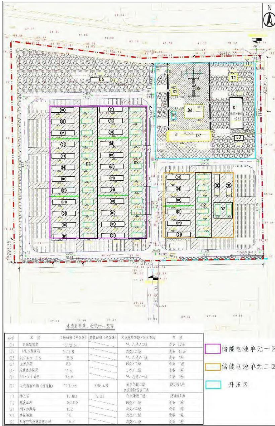
图 3-1 类比项目总平面布置图

由图 3-1 可知，类比项目变压区位于储能电站北侧，220kV GIS 位于主变的北部，类比项目平面布置和本项目储能电站平面布置基本一致。