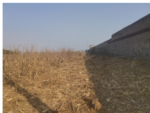
站址拟建区域北侧