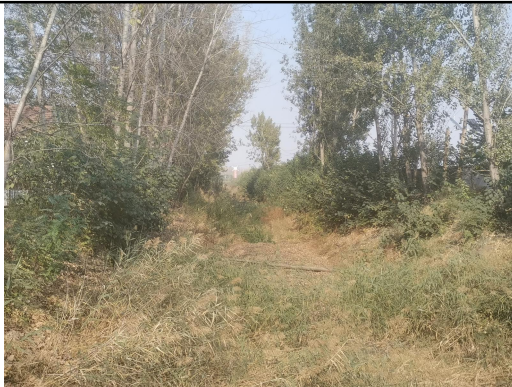
站址拟建区域东南侧