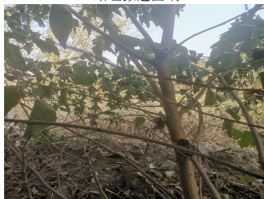
站址拟建区域东侧