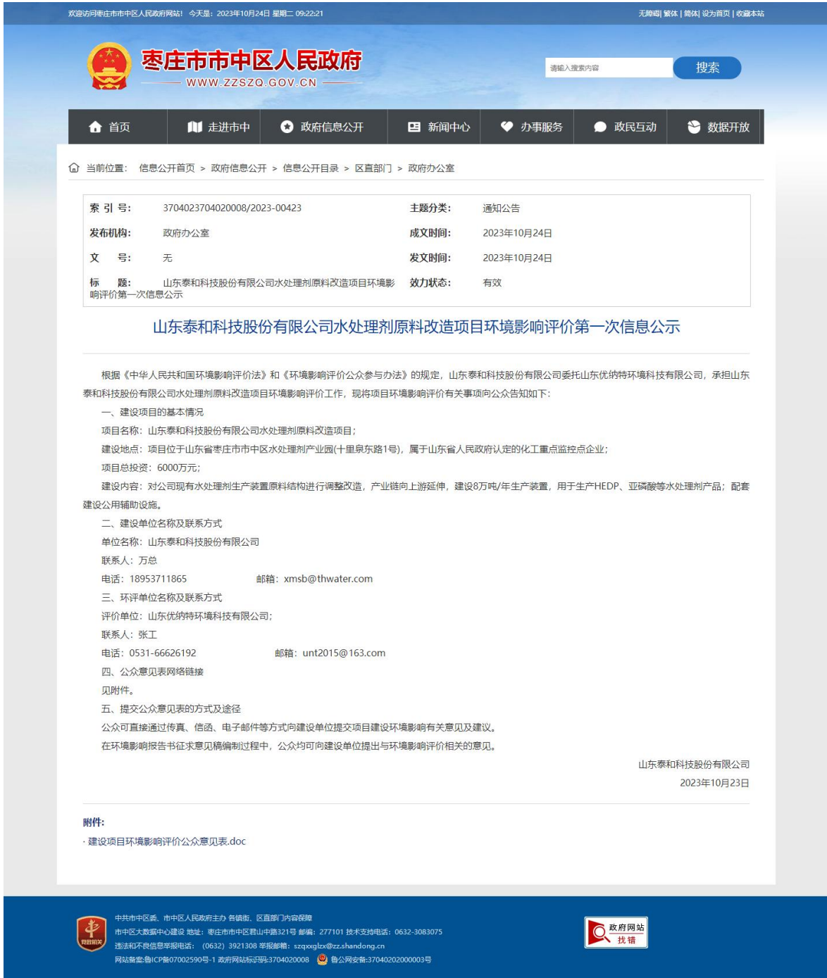
图 2-1 第一次公示网上截图