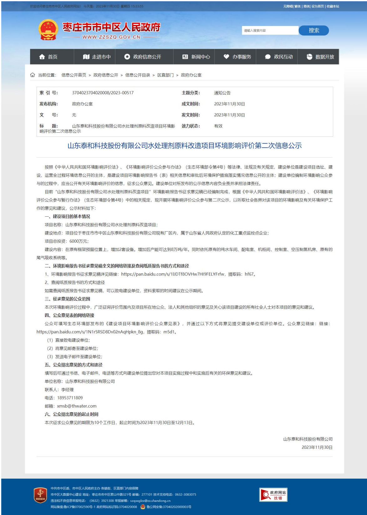
图 2-2 征求意见稿公示网站截图