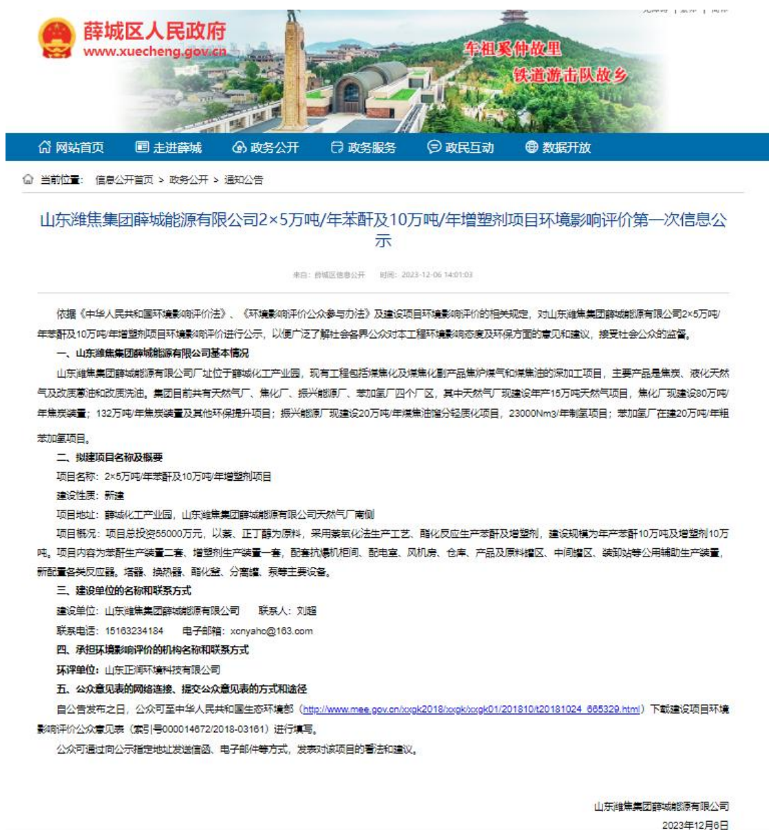
图 2.2-1 第一次公示网站截图

建设单位2023年12月6日于薛城区人民政府网站进行了首次公示。公示网址： http://www.xuecheng.gov.cn/zwgk/tzgg/202312/t20231205_1799671.html ，网站截图如图2.2-1所示。