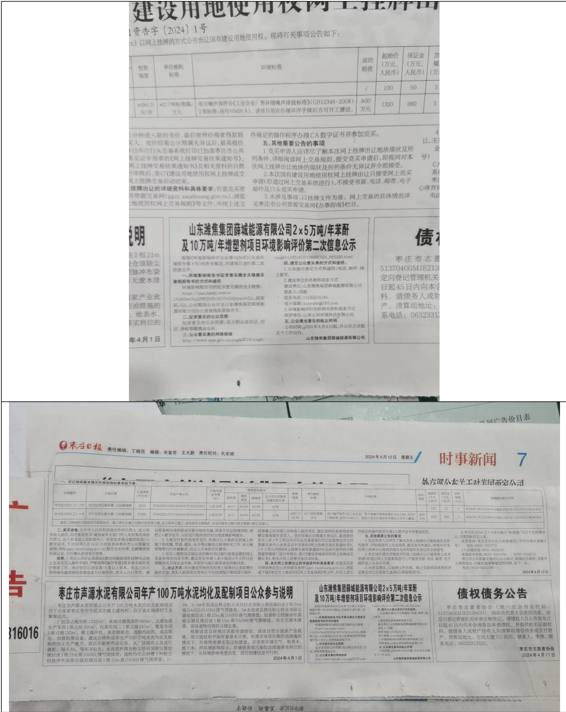
图 3.2-3 2024 年 4 月 12 日第二次公示报刊截图