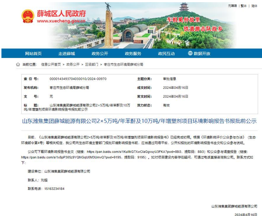
图 6.2-1 报批前公示网站截图