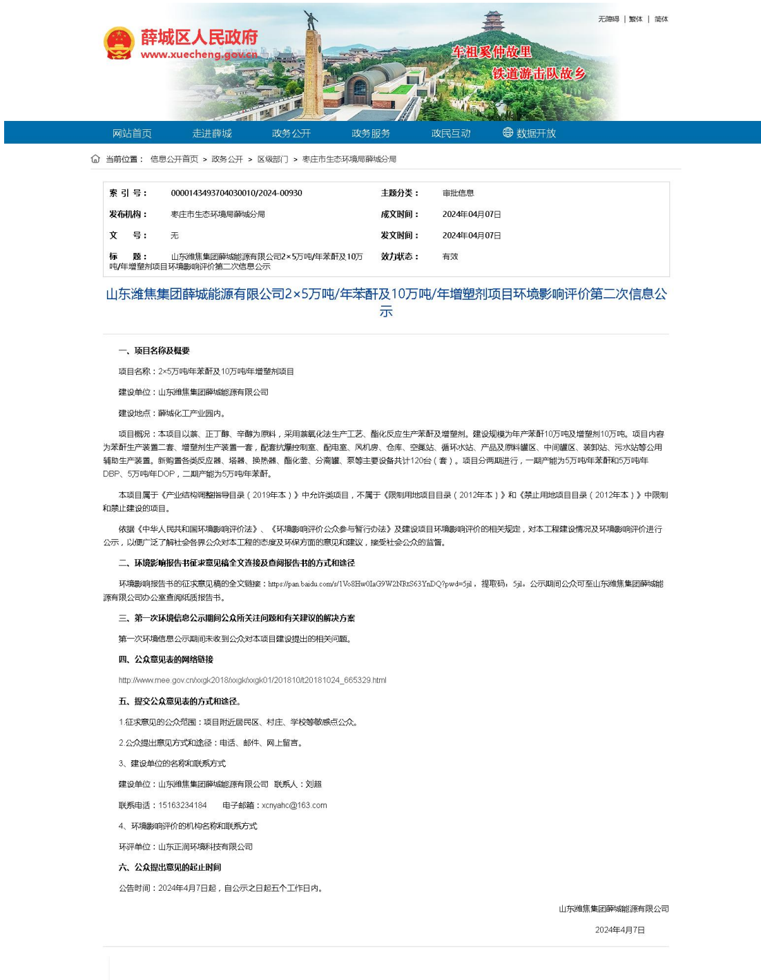
图 3.2-1 第二次公示网站截图