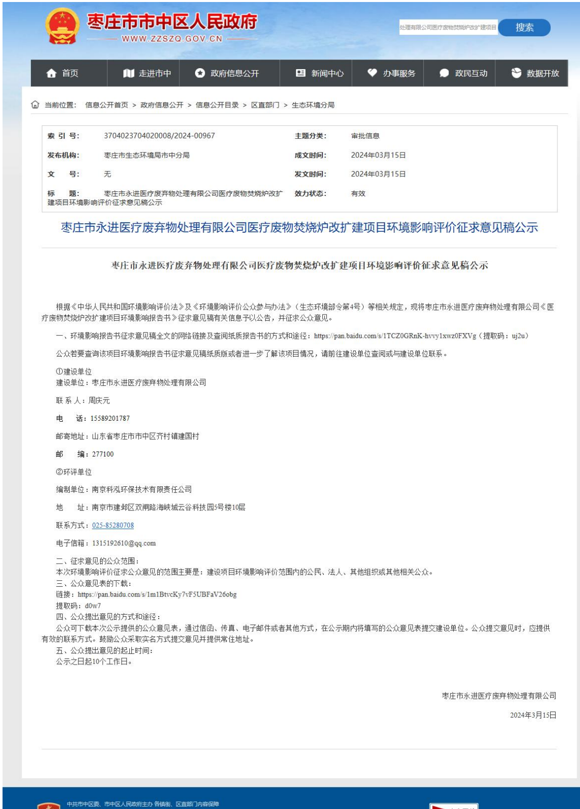
图 3-1 征求意见稿网上公示截图