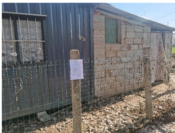
西北侧 150m 养殖看护房 4