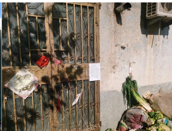
东南侧 185m 看护房 1