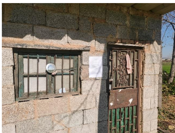
东侧 125m 看护房 2