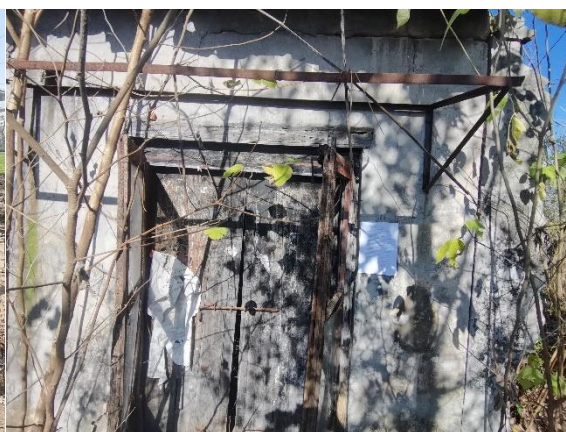
西侧 120m 农田看护房 5