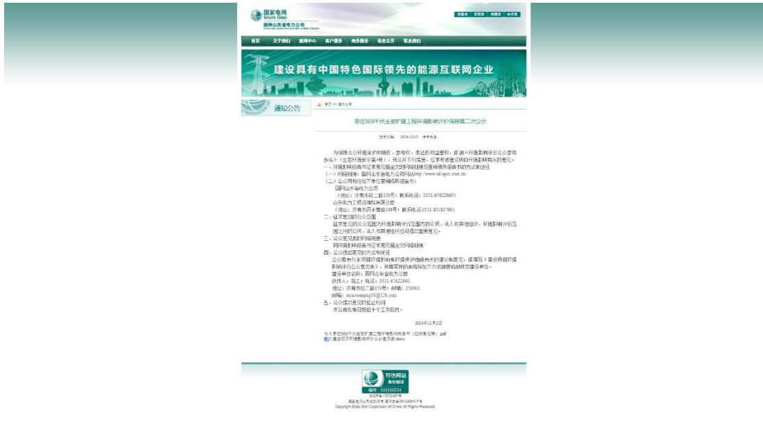
图 3-1 2024 年 12 月 2 日网络公示截图

公示选择建设单位国网山东省电力公司网站，载体的选择符合《环境影响评价公众参与办法》第十一条相关要求。