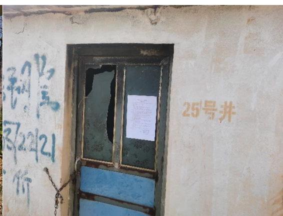
东北侧 150m 看护房 3