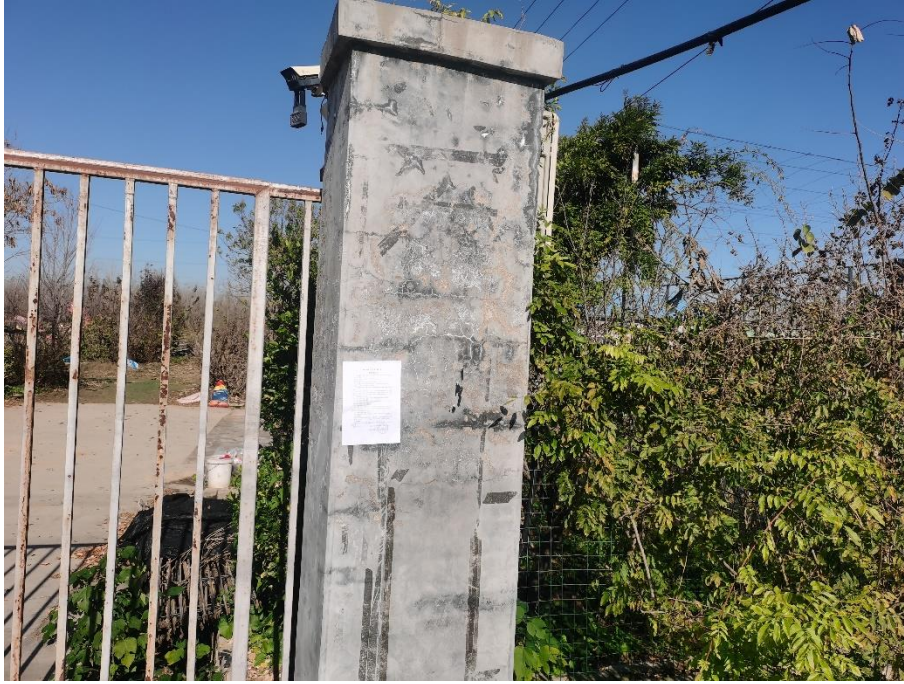
西南侧 160~190m 养殖看护房 6