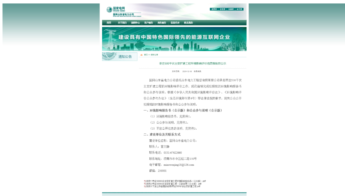
图 6.2-1 报批前网络公示截图

公示选择建设单位国网山东省电力公司网站，载体的选择符合《环境影响评价公众参与办法》第二十条相关要求。