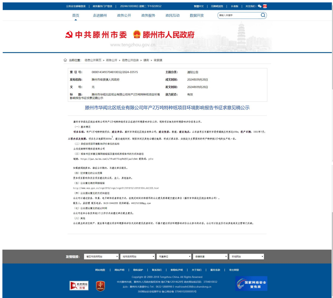
图 2-1 征求意见稿公示网络截图