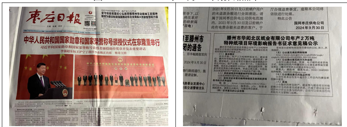
图 3-2 (2) 2024 年 9 月 30 日报纸照片