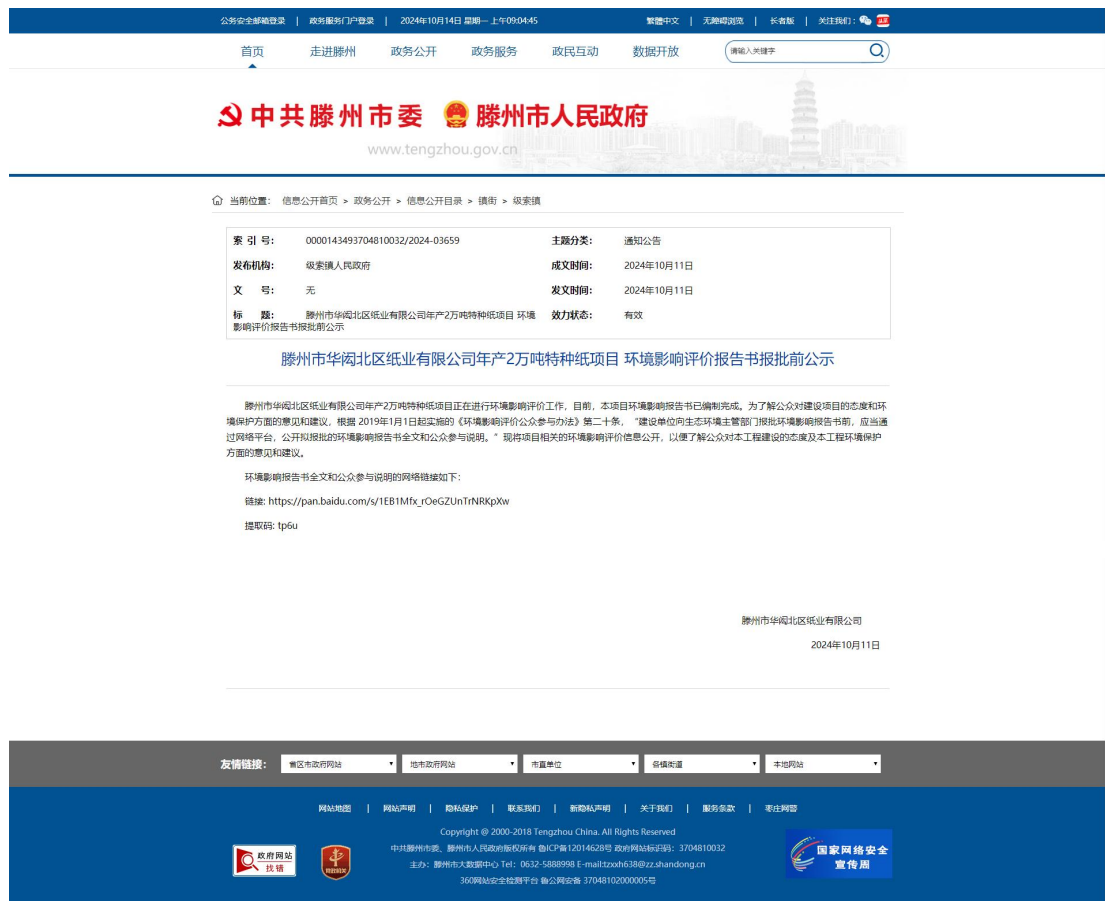
图 4-1 报批前公示截图