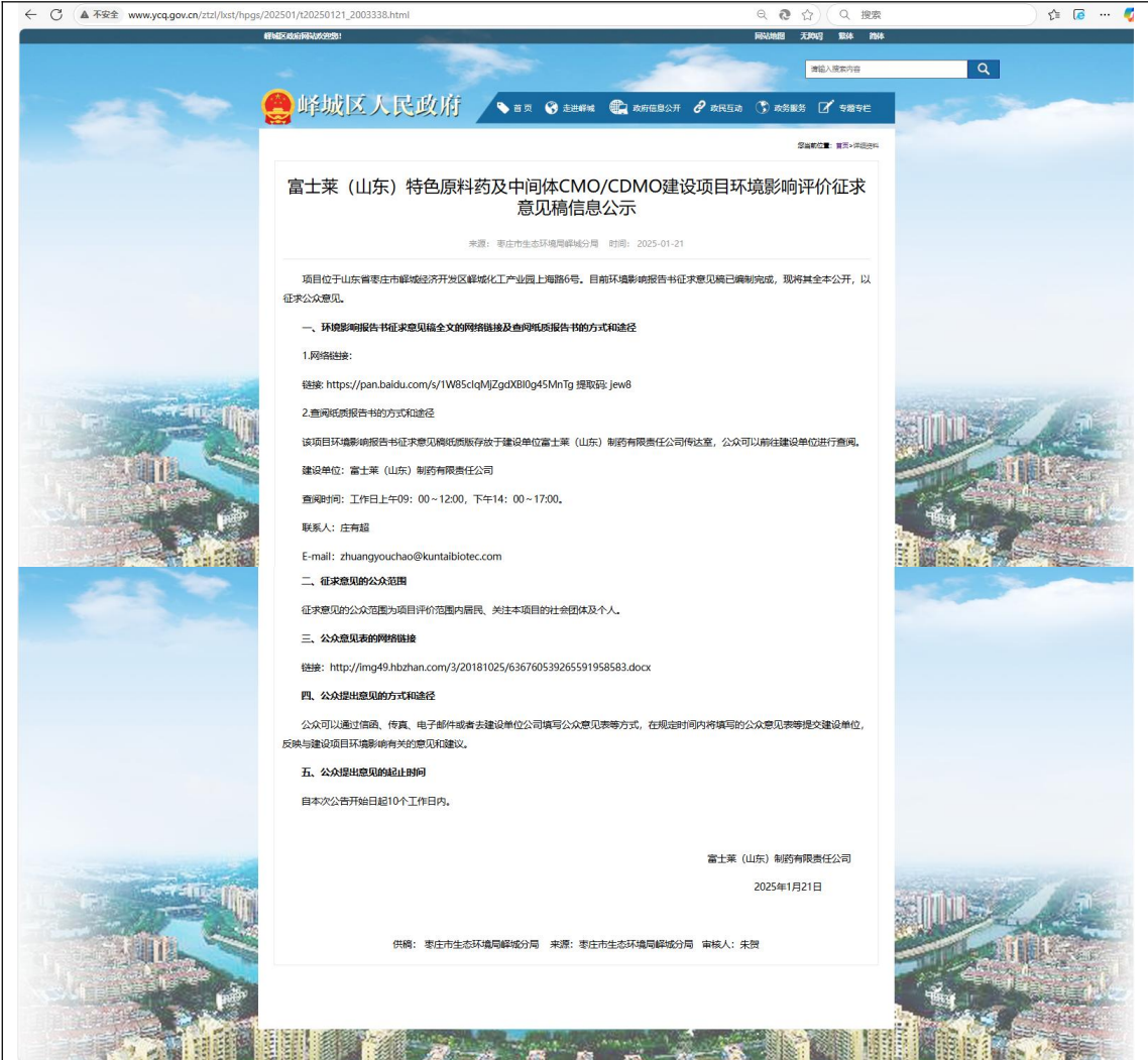
图 3-2 第二次公示网站截图