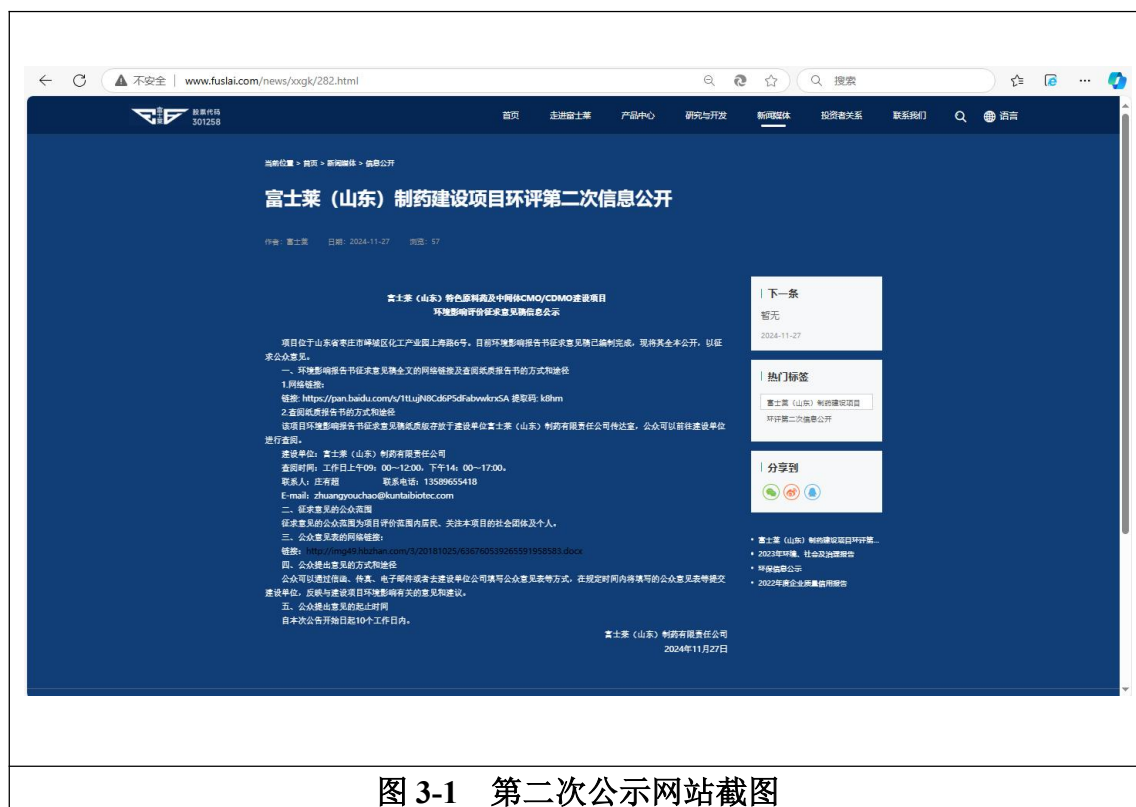
图 3-1 第二次公示网站截图