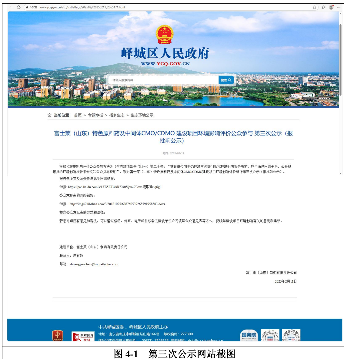
图 4-1 第三次公示网站截图