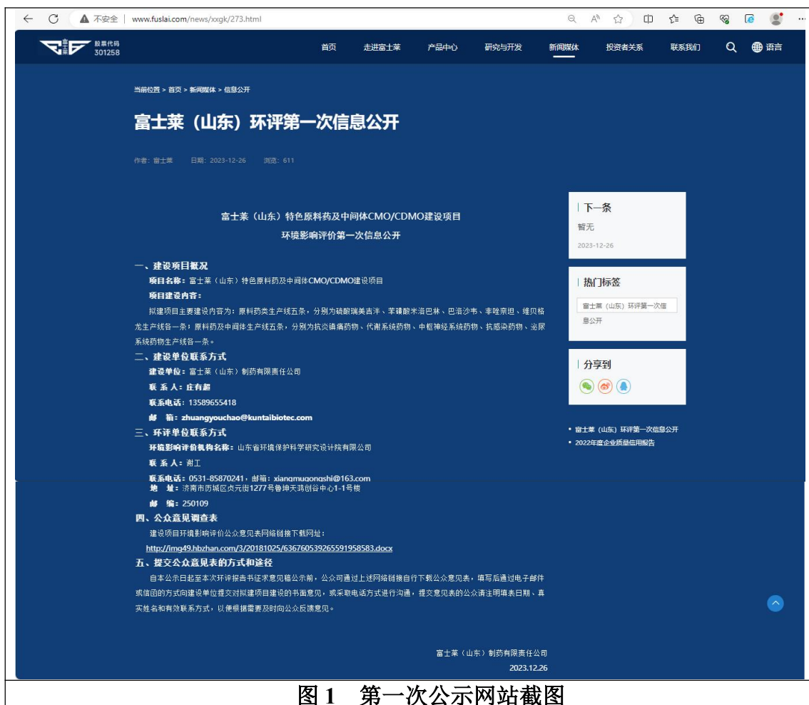
图1 第一次公示网站截图