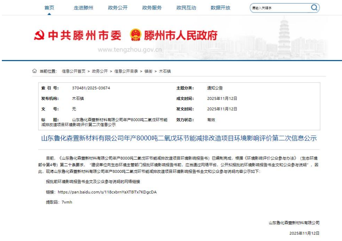
图 5-2-1 网站公示截图