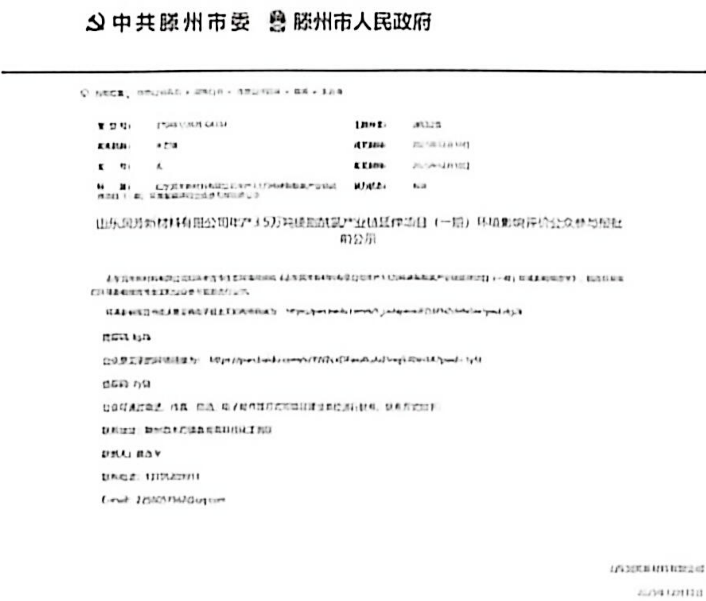
图 6-1 报批前公示网络截图

我单位已按照《办法》要求，在山东润芳新材料有限公司年产 3.5 万吨硬脂酰氯产业链延伸项目(一期)环境影响报告书编制阶段开展了公众参与工作，在征求意见期间未收到反对意见，并按照规定编制了公众参与说明。