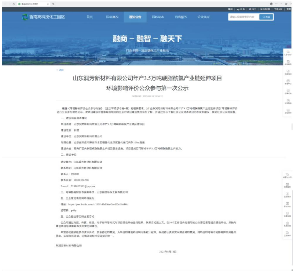
图 2-1 第一次网络公示截图