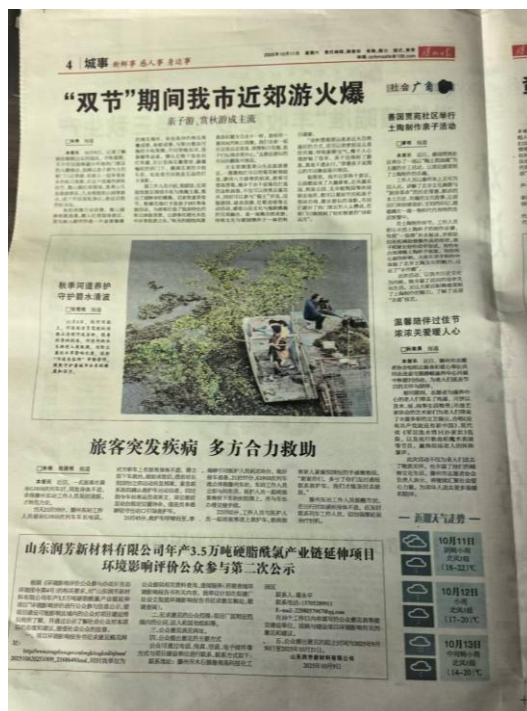
图 3-2 报纸公示照片